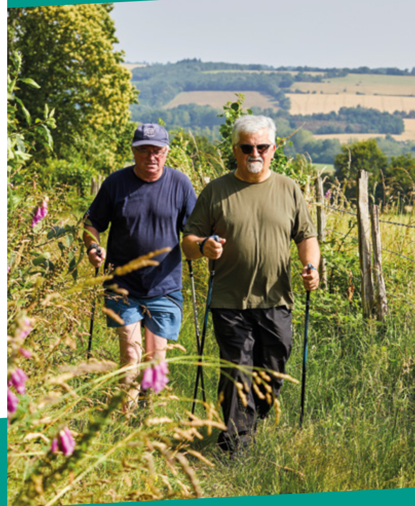
Création graphique : service com BPLC - Juin 2019

Service Tourisme Bretagne porte de Loire Communauté