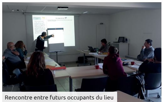
Rencontre entre futurs occupants du lieu