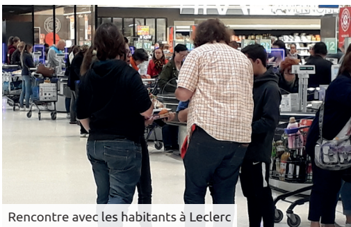
Rencontre avec les habitants à Leclerc