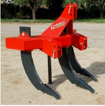
Décompacter le sol en profondeur avec un fissurateur ou sous-soleur