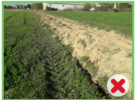
Talus de mottes réalisé sans aucune préparation de sol