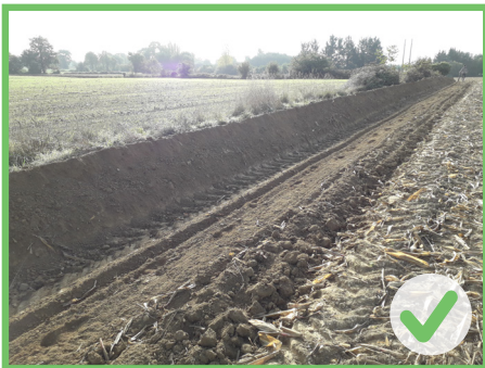
Talus propre bien réalisé, sans motte

La réalisation du talus à la charrue forestière est conditionnée par un bon travail du sol préalable :