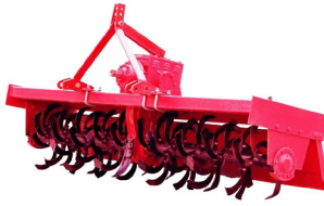
Émietter le sol en surface avec un rotavator